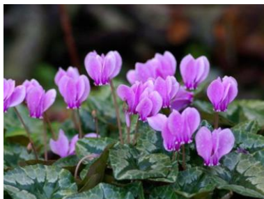
B Efeļlapu ciklamena Cyclamen hederifolium (Alpu vijolīte)