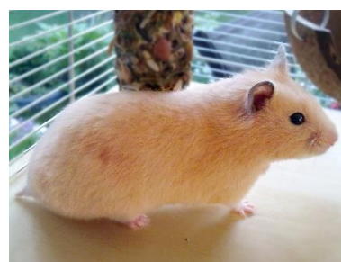
L Zeltais kāmis Mesocricetus auratus