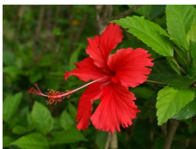
D Ķīnas rozes hibisks Hibiscus rosa-sinensis (Ķīnas roze)