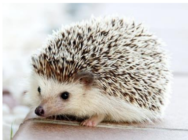
A Āfrikas pundurezis Atelerix albiventris

3. Dažādi augi un dzīvnieki, ko varam sastapt savās istabās, ir nākuši no dažādām pasaules vietām. Daudzas no šīm sugām ir nokļuvušas citur pasaulē un dabā ir kļuvušas invazīvas. Iezīmē kartē tikai to dabiskās izplatības areālus! (12 p)