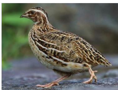
H Paipala Coturnix japonica