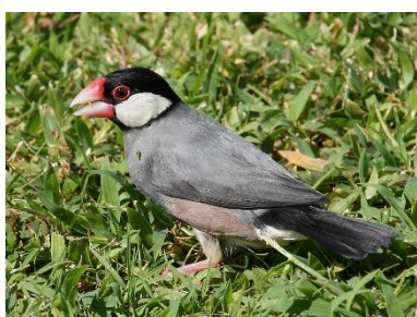
J Rīsu žubīte Padda oryzivora