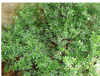
G Mirte Myrtus communis