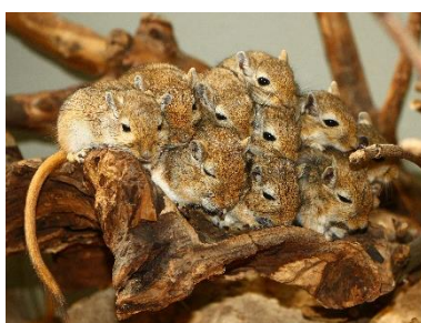
K Smilšu pele Meriones unguiculatus