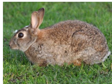
C Eiropas trusis Oryctolagus cuniculus