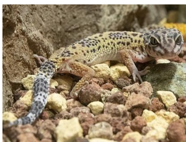
E Leopardu gekons Eublepharis macularius