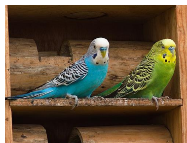
I Pundurpapagailis Melopsittacus undulatus