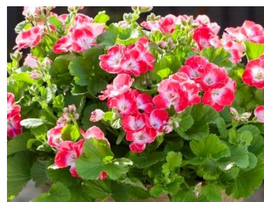
F Lielziedu pelargonija Pelargonium grandiflorum